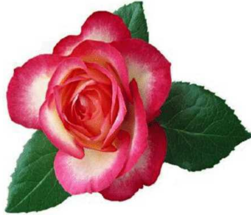
(ग) एक फूल